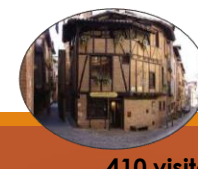
Maison du Viel Albi février à décembre

2 789 visiteurs (+14,30%) Cumul 2018 : 16 182 (+20,49%)