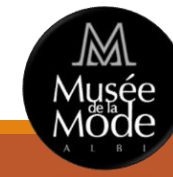
Musée de la Mode ALBI

1 804 visiteurs (-0,55%) Cumul 2018 : 8 973 (-4,24%)