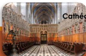
Chœur Cathédrale Ste-Cécile

2 030 visiteurs (- 23,14%) Cumul 2018 : 5 099 (6,41%)