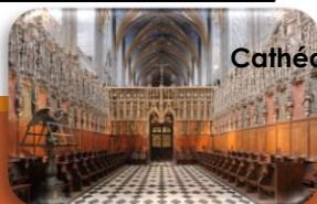
Chœur Cathédrale Ste-Cécile