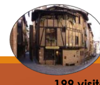
Maison du Viel Albi février à décembre

Musée de la MODE ALBI avril à décembre 2 844 visiteurs (+20,05%) Cumul 2018 : 19 026 (+20,43%)