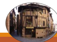
Maison du Viel Albi