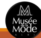
M Musée de la Mode ALBI