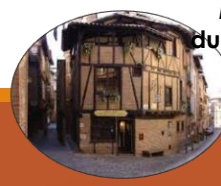
Maison du Viel Alby février à décembre

avril à décembre 2018 : 25 411 V (+18,39%) 2017 : 21 463 V