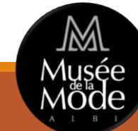
Musée de la Mode ALBI

2018 : 10 293 V (-3,82%) 2017 : 10 702 V